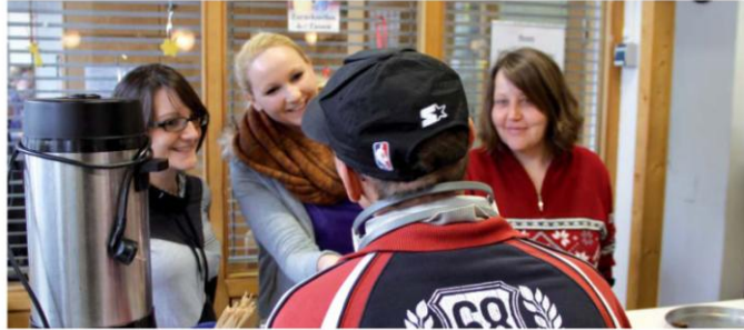
Der Tag in der Bahnmissionsmission wird sicher nicht der Letzte sein.